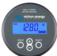
Bluetooth-Erkennung: BMV-712 Smart Battery Monitor