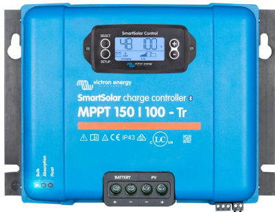
SmartSolar-Lade-Regler MPPT 150/100-Tr mit optionalem einsteckbarem Display