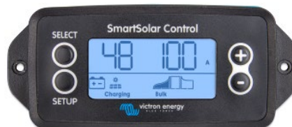
Einsteckbares SmartSolar display