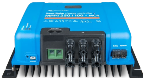
SmartSolar-Lade-Regler MPPT 150/100-MC4 ohne Display